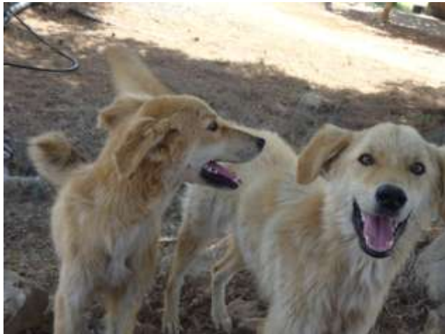
Ihr Animal Castration Team

Vielen Dank für Ihr Interesse an unseren Projekten, unserer Arbeitsweise, unseren vierbeinigen Schützlingen und griechischen Kollegen !